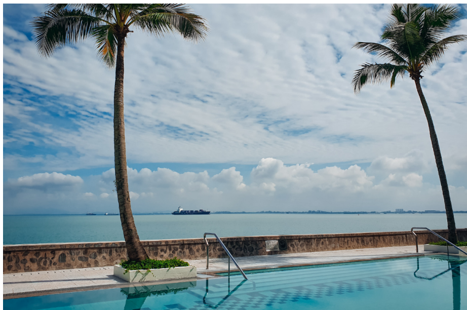
Heritage Wing -siiven allas sijaitsee aivan meren äärellä.