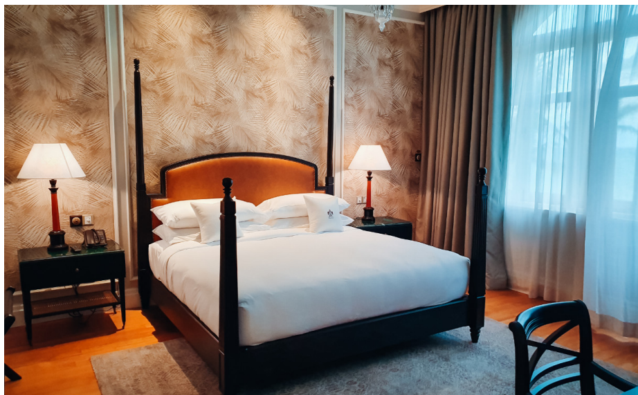
Hotellin sviiteissä on king size -kokoiset vuoteet.