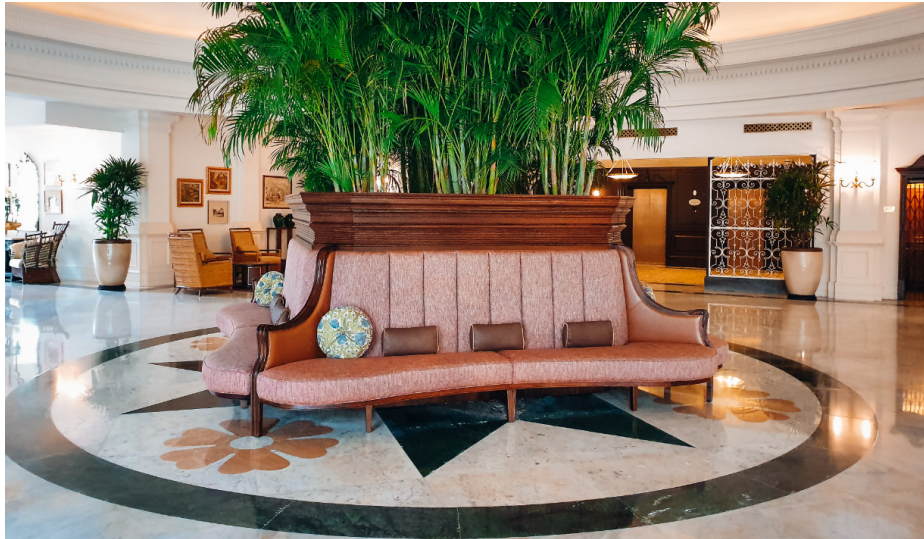
Eastern & Oriental Hotel -hotellin aulassa on kuvattu Crazy Rich Asians -elokuva.