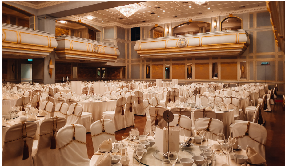
Hotellin suuressa juhlatilassa voi järjestää vaikka häät.