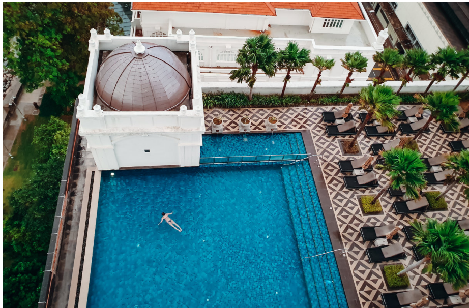
Hotellissa on kaksi uima-allasta, joista toinen on Victory Annexe -puolen infinity pool -allas.