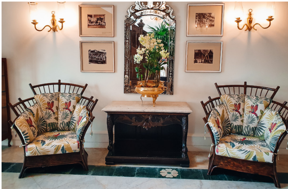
Hotellin sisustuksessa on hyödynnetty sen historiaa ja kauniita yksityiskohtia.