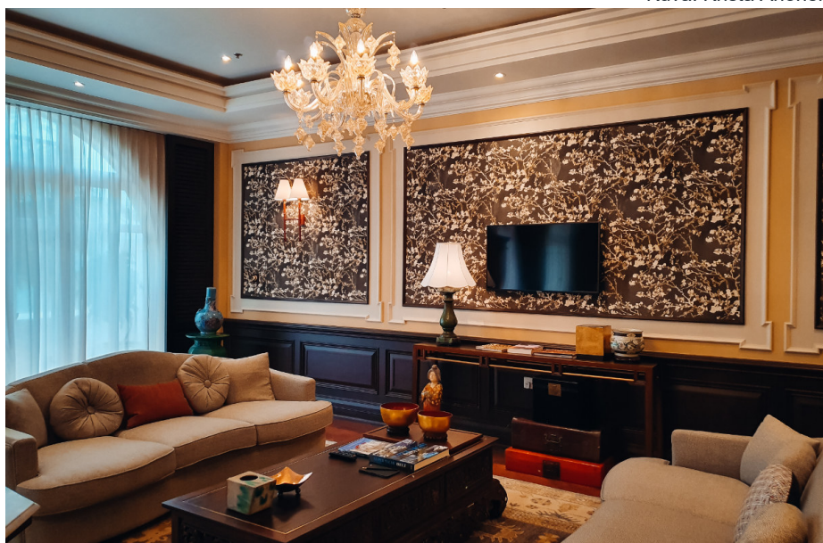
Huoneisiin mahtuu myös erillinen oleskelutila sohvineen.