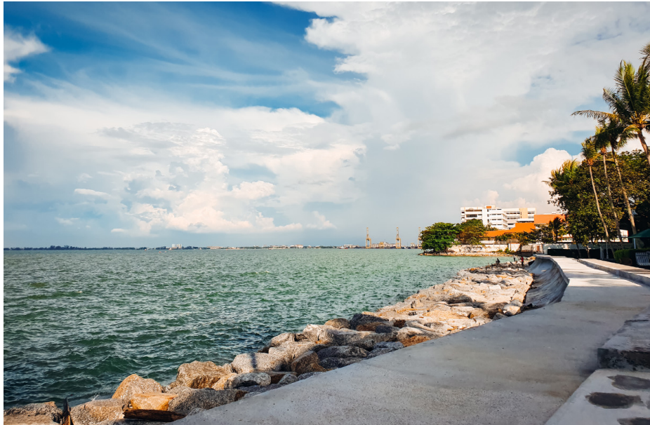
Hotelli sijaitsee keskeisellä paikalla George Townissa, mutta meren läheisyys luo rauhallisen tunnelman.

>> Lue myös: Voiko kuka tahansa vieraila tunnetuissa luksushotelleissa, vaikka ei majoittuisi niissä? 5 tapaa