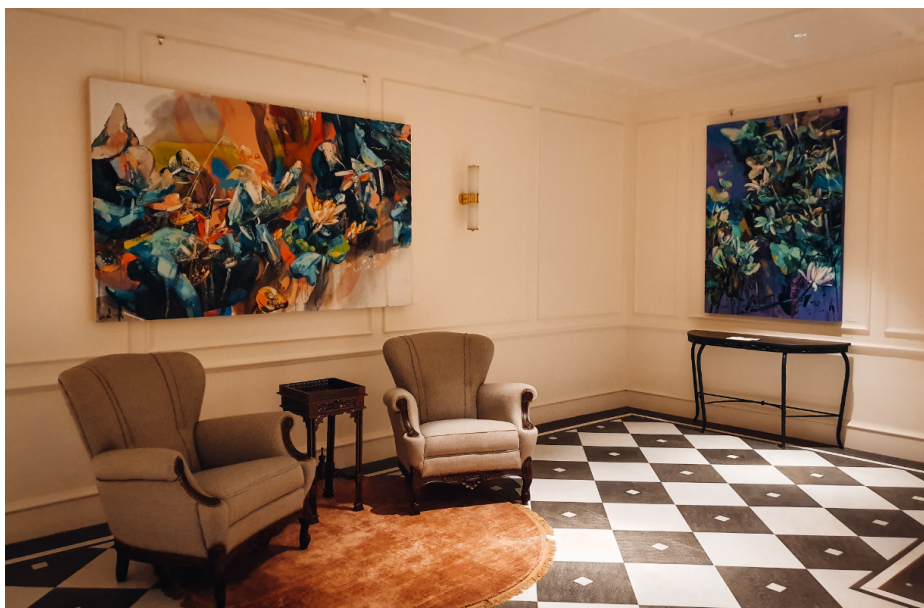
Hotellin seiniltä löytyy taideteoksia, joista osa on myös myytävänä.