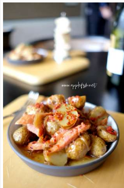
Cocktail Potato RM10