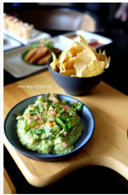
Crispy Tortilla Chips RM15