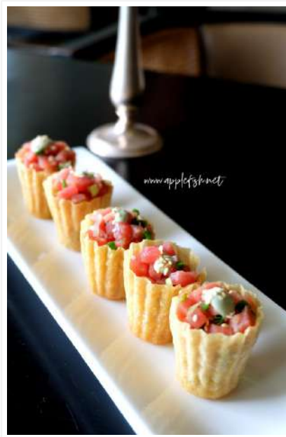
Tuna Tartar RM18