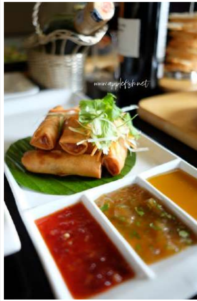
Vegetables Spring Rolls RM10