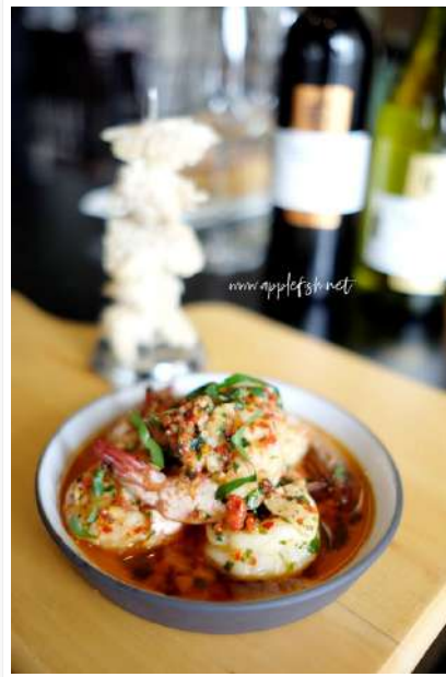
Spicy Garlic Prawn RM20