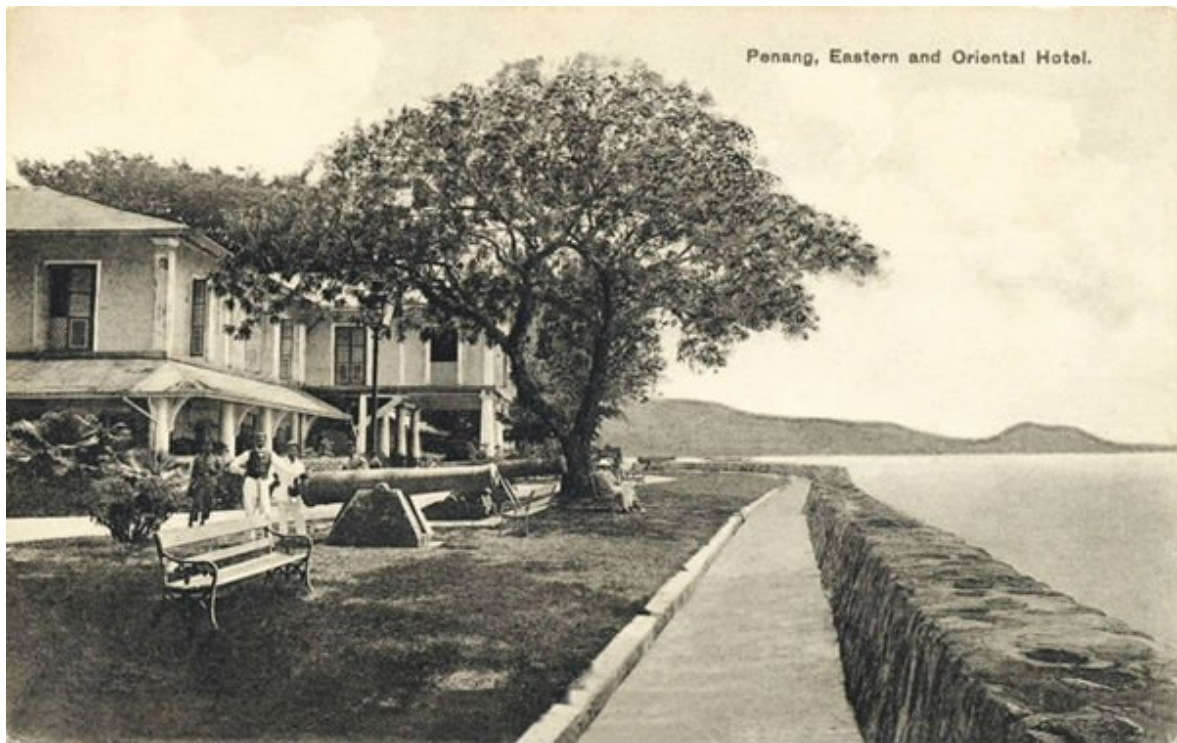
爪哇树见证了酒店的繁荣成长。