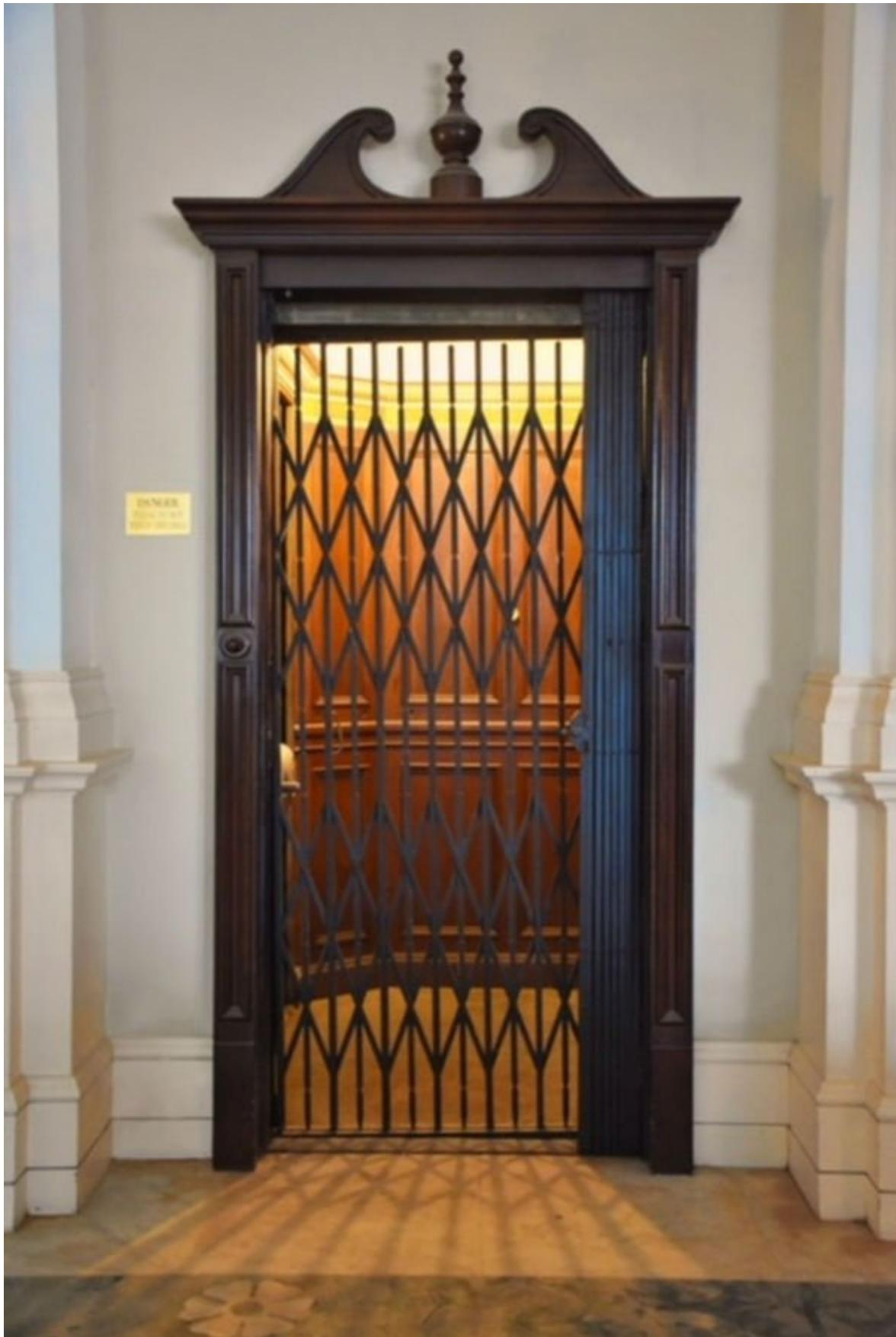
Waygood Otis升降机也是酒店保存的文物之一。