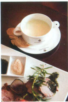
当日汤品为Potato & Leek Soup，记得搭配酒店烘焙师自制的优质面包。