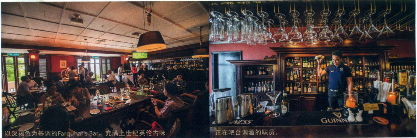
以深褐色为基调的Farquhar's Bar，充满上世纪英伦古味。